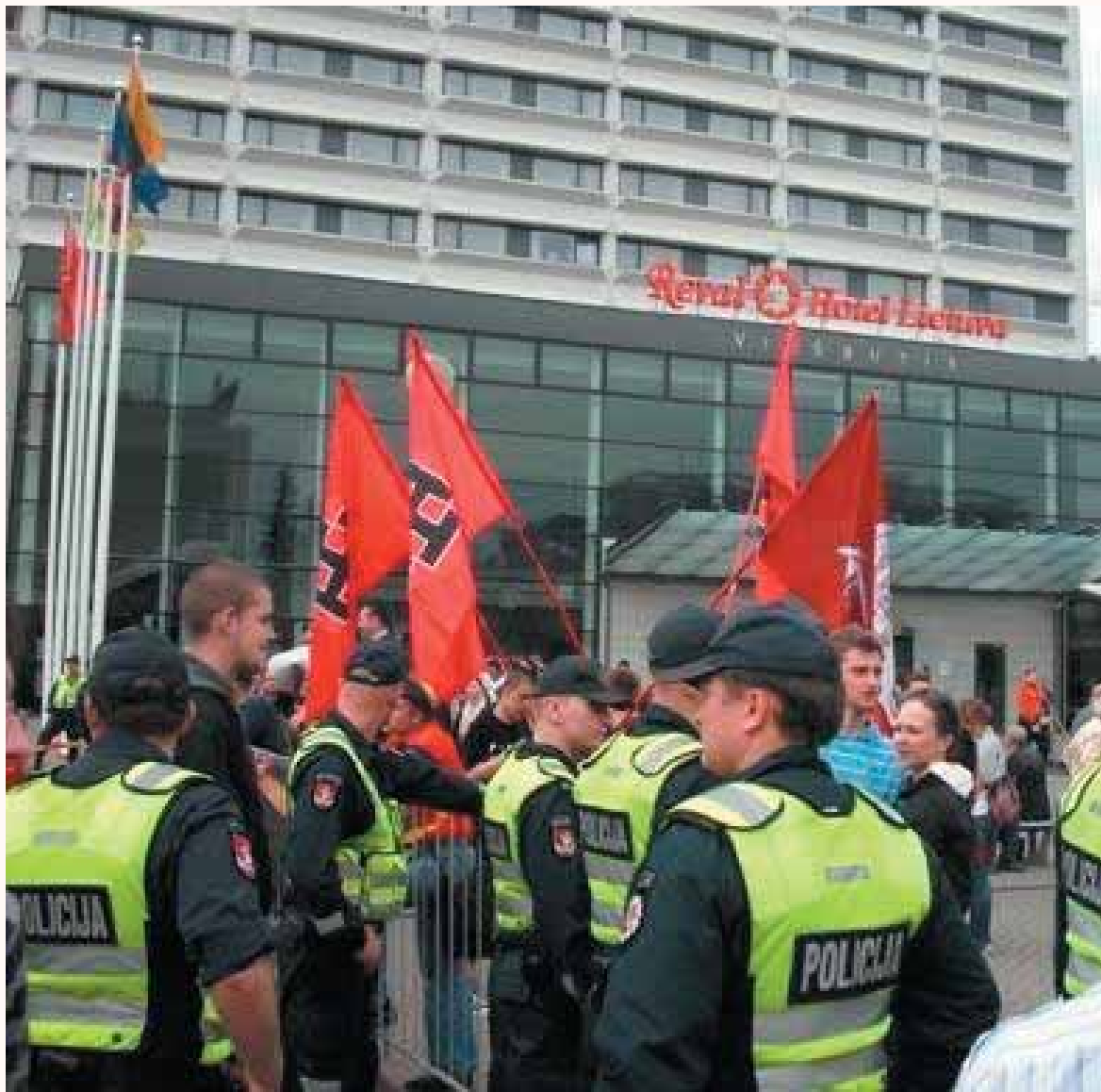
דעם 8טן מאי האבן פאשיסטן דעמאנסטרירט שעהן לאנג לעבן איינעם פון די גרעסטע האטעלן אין ליטע ("עוואל" - ליטעוואווא) מיט ריזיקע פאנען מיט אביסל "איבערגעבליבענע" סוואסטיקאס. אז מען האט ביי די פאליציי א פריגע געטאן, ווי אזוי דערלאזן זיי דאס, האבן זיי געזען פערט, אז דער געזען איז בלויז קעגן "פיקטלעכע" סוואסטיקאס.