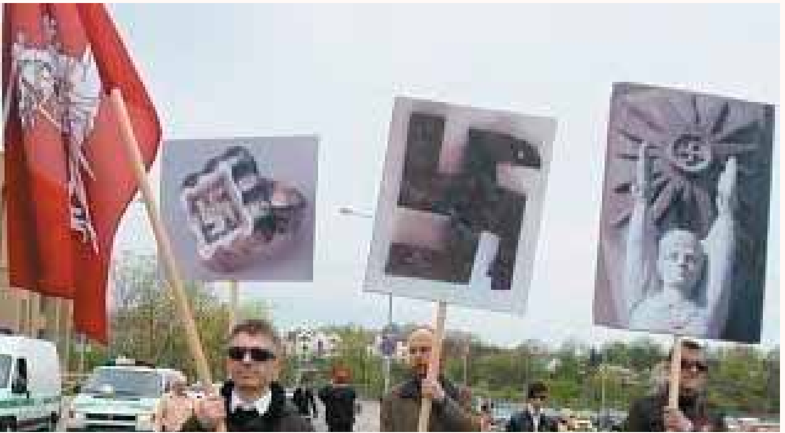
פלאַקאַטן מיט ריזיקע סוואַסטיקאַס, מיט וועלכע עס האָבן זיך אַרומגעטראָגן נעגאַטיוו פאַשיסטן אין דער ליטווישער שטאַט קלייפּעדיע (אַמאָליקער מעמל) לעצטן פעברואַר. אַדאַ ניט לאַנג, דעם 19טן מאי, האָט אַ געריכט באַשלאָסן אַז די פאַשיסטן האָבן קיין זאַך ניט געטאָן וואָס איז אומלעגאַל, ווייל סוואַסטיקאַס זיינען „די היסטאָרישע ירושה פון ליטע, ניט סימבאָלן פון נאַציזשן דייטשלאַנד“.