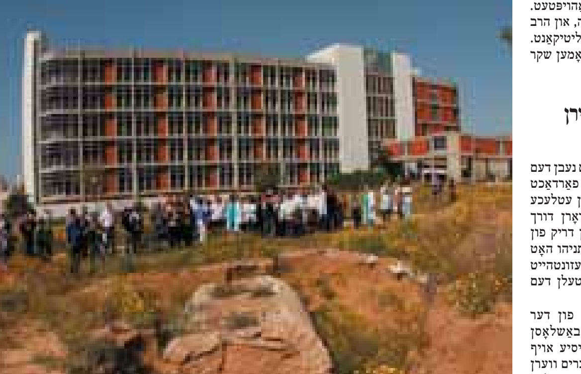
"ברזיליי"-שפיטאל אין אשקלון

באַזאַמטע האָבן ערשט פאַרדעקט אַלס דאָס טריטלעכע ביאָלאָגישע „אַנטראַקס“ געווער. עס איז אַנטשטאַנען אַ גרויסער טומל, און גרויסע זיכערקייטס-כּוחות זענען אַלאַרמירט געוואָרן. ערשט נאָך אַ גרינטלעכער אונטערוכונג האָט זיך אַרױסגעשטעלט, פאַרדעקט וועגן, אַז דער קאַנווערט געשיקט געוואָרן געוואָרן מיטן ציל אַרױסצורופן אַ פּאַניק. בייגעלייגט צום קאַנווערט מיטן שטויב איז געווען אַ דערקלערונג: „צײַטשטישע נאַציש, דאָס איז פאַרן אױסרױמען די קברים אין אשקלון.“ לױט די פאַרדעקט וועגן, איז דער קאַנווערט געשיקט געוואָרן דורך די נױט-קראַנקעס, וועלכע ווײַכן נישט פון באַנוצן זיך אױך מיט די עקלאַפּטיקטע מיטלען אין זײער פּאַרמסט מיטן „צײַטשטישן וועגן“.