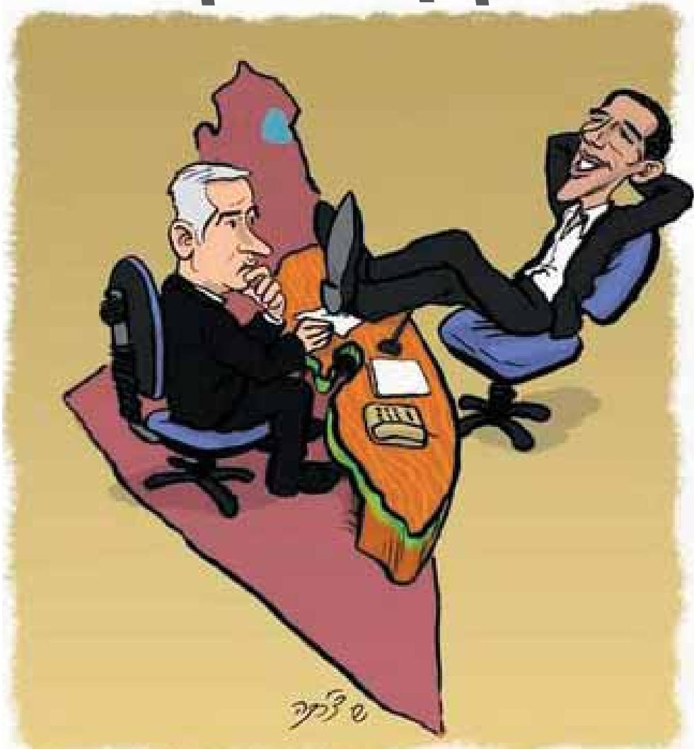
פון שלמה שמיר

ד' אמעריקאנער אידן, און באזונדערס די ארטאדאקסישע, האבן פארראטן ירושלים. מ'איז געווארן אפגעפרעמדט פון ירושלים, און דער, דעת הקהל, די פעטלעכע אידישע מיינונג אין אמעריקע, האט זיך לגמרי דערווייטערט און האט אפילו פארנאכאלעטיקט עמציאנעל, די הויפטשטאט פון אידישן פאלק.