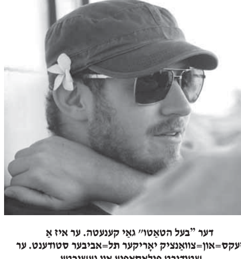
דער "על הטאַטו" גאַי קענעט. ער איז אַ זעקס-און-צוואַנציק יאָריקער תל-אביבער סטודענט. ער שטודירט פּילאָסאָפיע און געשיכטע.

ראשי-תיבות שטריכעלעך), אָבער ס'איז אַ שטאַרק אומגעלומפערטער שריפט=בילד, ארץ אוי ווייט אַז אַן נקודות איז שווער אָפּילו וויסן ווי אַווי מ'דאַרף ליינען: קעצעלעך" אָדער "קאָצעלע" (און אַרומטראַגן זיך מיט נקודות אַ גאַנצן לעבן איז קיין גאַנג ניט).